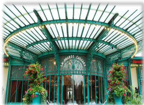
La Grande Cascade